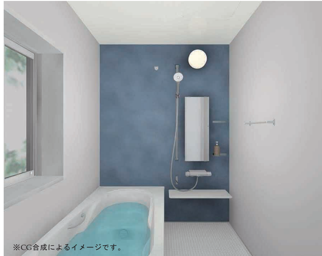
※CG合成によるイメージです。